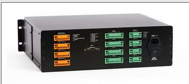
Eingangs-/Ausgangsanschlüsse auf der Rückseite

Dieselbe Anzeige- und Steuereinheit kann im mehrkanaligen 19"-Einschubgehäuse auch mit Feuchtemessungen oder Sauerstoffmessung in Flüssigkeiten kombiniert und ausgelegt werden (Liquidew I.S. Analysator oder den Minox-i O 2 Transmitter* für Feuchte in Flüssigkeiten).