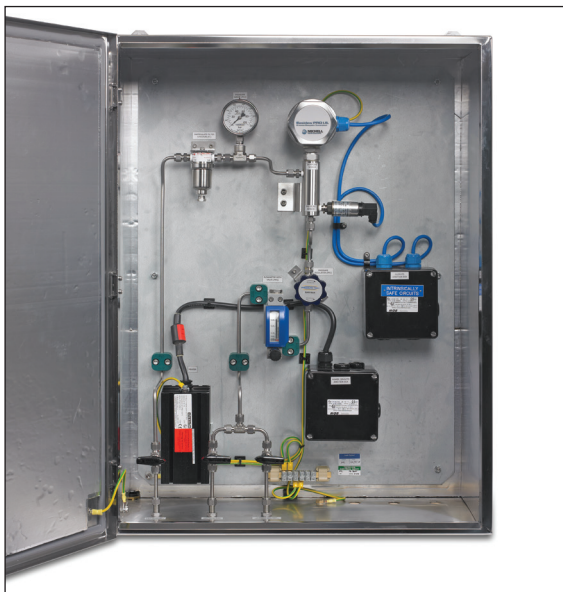
Promet I.S. Probenahmesystem

für die verwendeten Komponenten ist essentiell wichtig für dynamisches Ansprechverhalten auf schnelle Änderungen im Prozess. Ein Partikelfilter und ein Absperrventil sind die Hauptkomponenten vor dem Sensor.