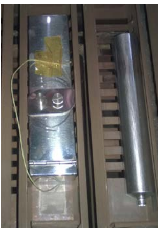
DATAPAQ MonoPaq2 im Einsatz im IBO-Ofen

DATAPAQ MonoPaq2 besteht aus dem hochmodernen Datenlogger DATAPAQ Q18, einem anwendungsspezifisch entwickelten Hitzeschutzbehälter und Halterungen zur sicheren und effizienten Befestigung an Tragstäben (IBO) bzw. in Körben (OBO). Der Miniaturdatenlogger DATAPAQ Q18 mit vier Messkanälen eignet sich optimal für diese Anwendungen, da auch der Hitzeschutzbehälter sehr klein ausgeführt werden kann. Dies sorgt für eine einfachere, sichere Handhabung und erweitert die Einsatzmöglichkeiten in Anlagen, die sehr wenig Platz für ein Messsystem bieten.