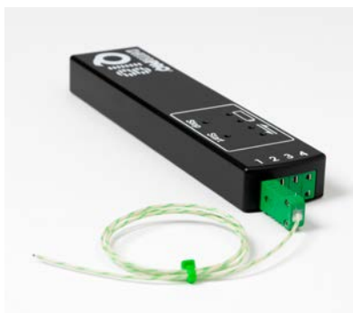
Miniaturdatenlogger DATAPAQ Q18, DQ1804