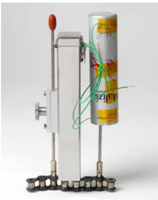
Hitzeschutzbehälter TB0072 mit Tragestabhalterung TB0073