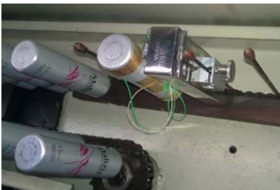
DATAPAQ MonoPaq2 im Einsatz im OBO Ofen

DATAPAQ MonoPaq2 ist ein Temperaturprofilssystem, das speziell für die Wärmebehandlung beschichteter Aluminiumflaschen, -sprühdosen und -tuben entwickelt und optimiert wurde. DATAPAQ MonoPaq2 eignet sich zur Überwachung von IBO- und OBO-Öfen (Inside und Outside Bake Ovens), in denen die Beschichtung der Innen- bzw. Außenseiten der einteiligen Aluminiumbehälter („Monoblocks“) gehärtet wird.